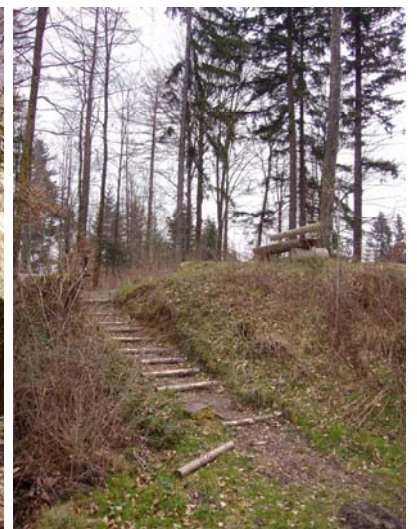
Chutzen höchster Punkt auf dem Frienisberger

Weitere Informationen über den Frienisberger und seinen Namen www.dillum.ch/html/frienisberg_namenlandschaft.htm